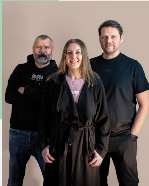
Geschäftsführung NOS MONACO GmbH

NOS steht für Nation of Sports und symbolisiert unsere Wurzeln und Leidenschaft für Sport und Bewegung. Diese Energie fließt in jedes unserer Designs ein, um ein Gefühl von Aktivität und Vitalität zu vermitteln.